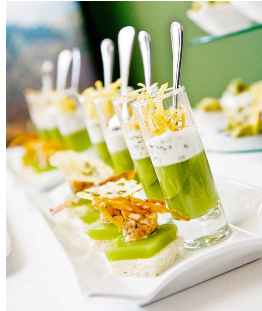
Kreationen für die Eröffnungsfest vom Weingut Schloss Proschwitz