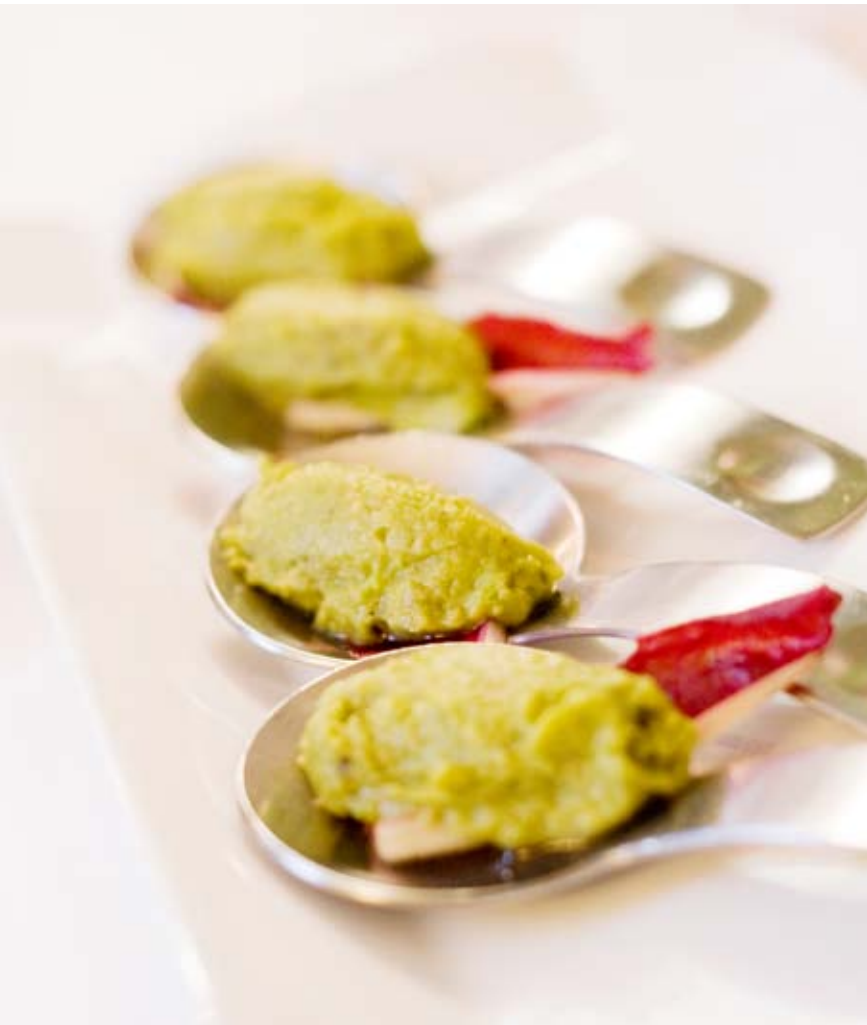
Kreationen für die Eröffnungsfest vom Weingut Schloss Proschwitz