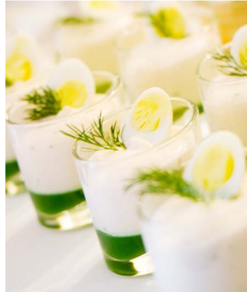
Kreationen für die Eröffnungsfeier vom Weingut Schloss Proschwitz