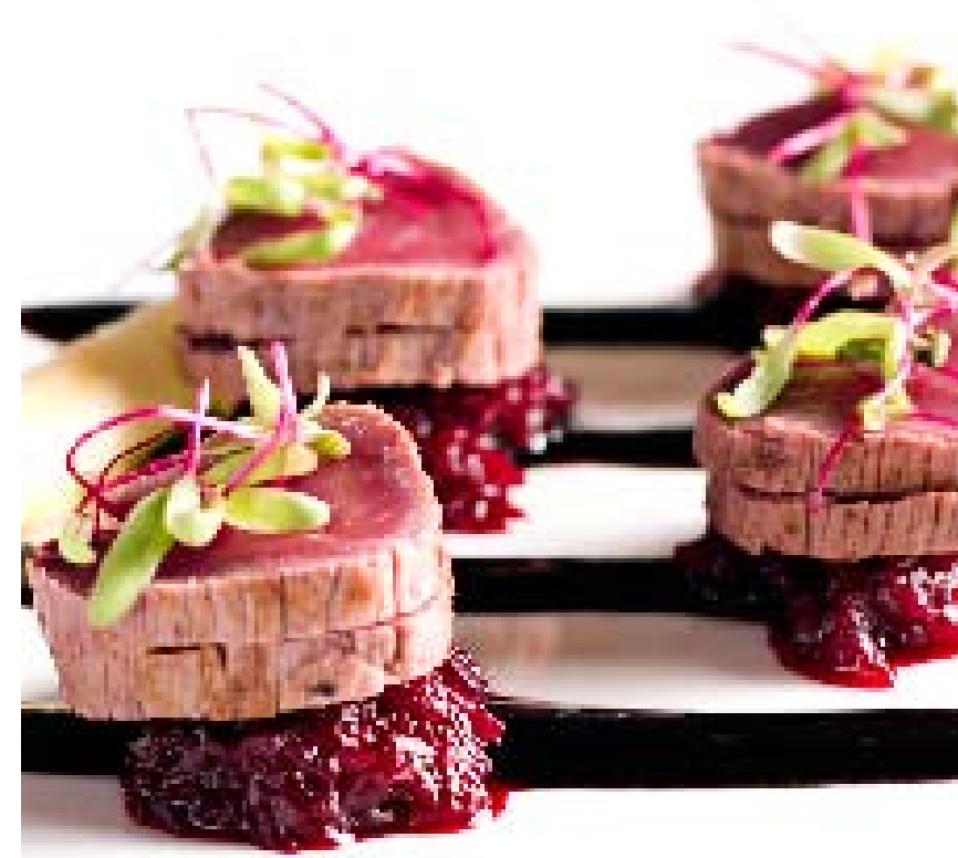
Kreationen für die Eröffnungsfeier vom Weingut Schloss Proschwitz