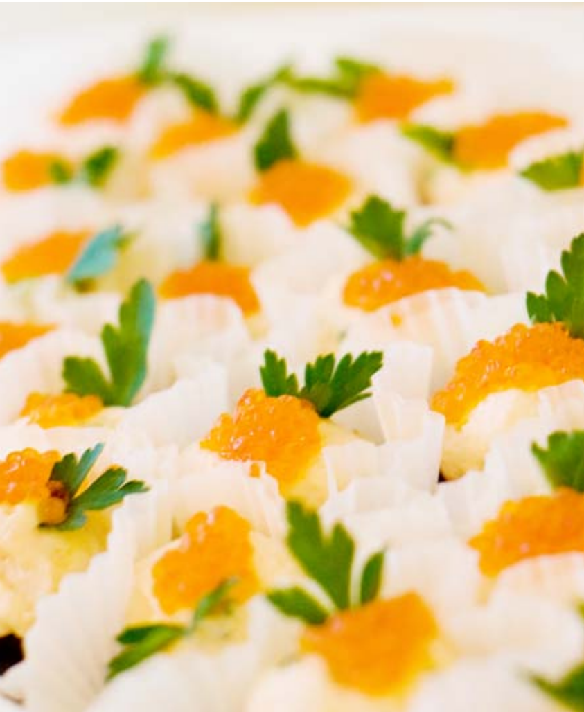
Kreationen für die Eröffnungsfest vom Weingut Schloss Proschwitz